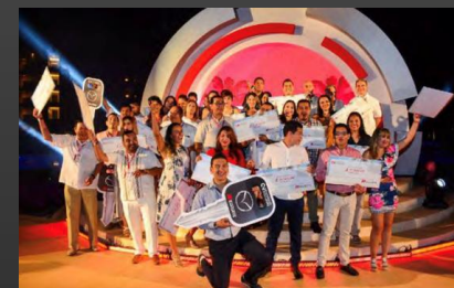
ORGANIZACIÓN DE EVENTOS