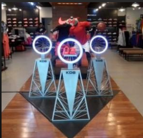
PUNTO DE VENTA